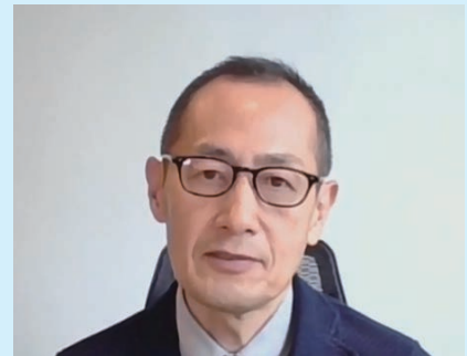
京都大学iPS細胞研究所 山中先生

講演者 山中 伸弥先生 (京都大学iPS細胞研究所所長・ 証券奨学同友会員 1987年本財団奨学生修了) ※ 役職は講演当時のもの